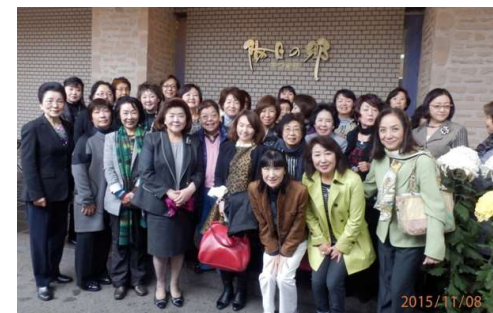
2015.11 東京産業人クラブ女性会の皆様と被災地を視察 二本松市岳温泉にて夕食交流会

●「福島を元気に」が合言葉 女性経営者の皆さん、FJPに入って、私たちの福島を、福島復興のために活動していきましょう。