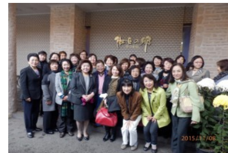
H27(2015年)11月東京産業人クラブ女性部会の皆様と被災地を視察、二本松岳温泉にて夕食交流会。